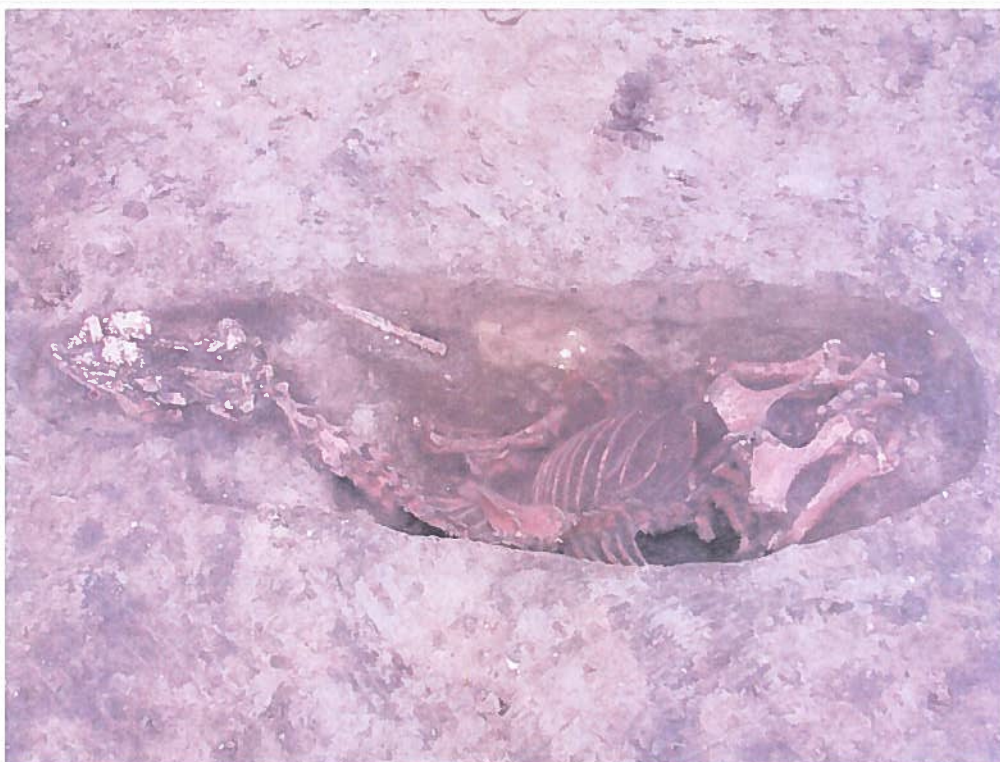
Mormânt de cal