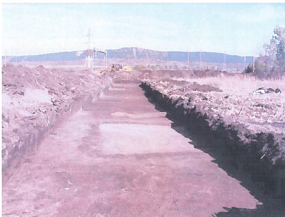
Locuințe – la identificare