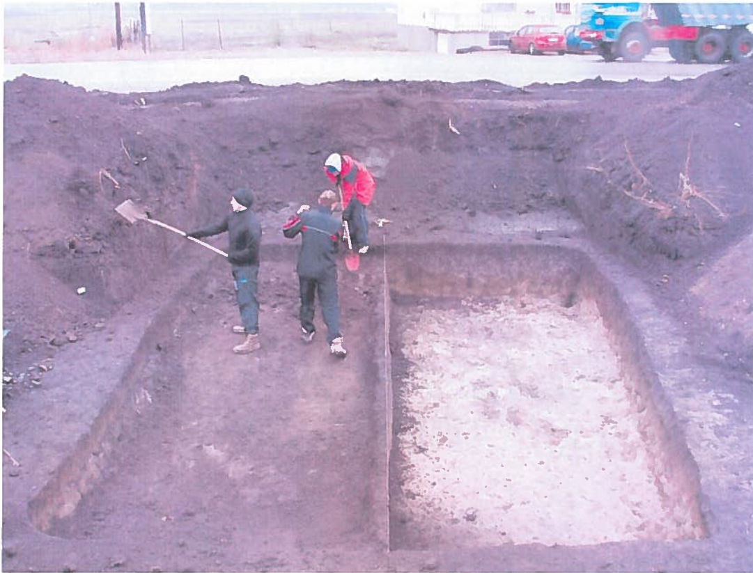
Locuință în curs de cercetare