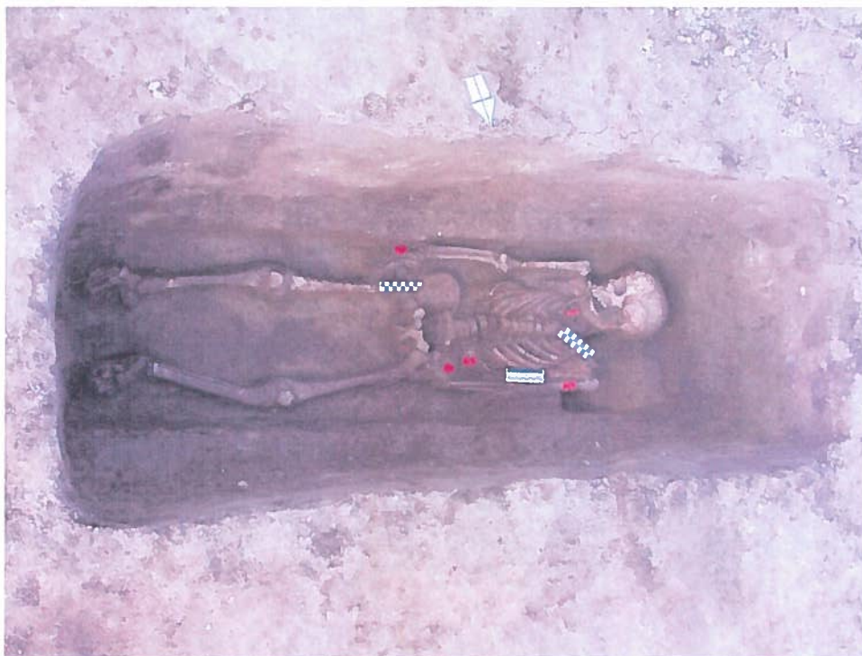
Mormânt de înhumăție