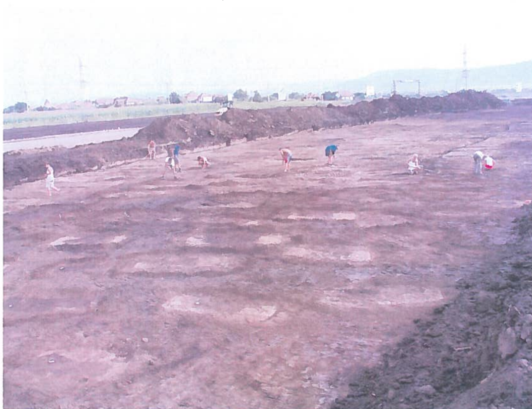
Morminte – la identificare