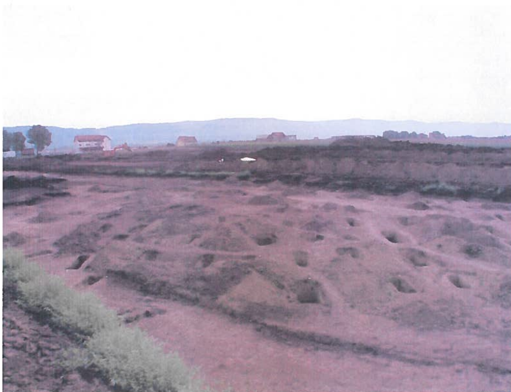
Morminte – după cercetare